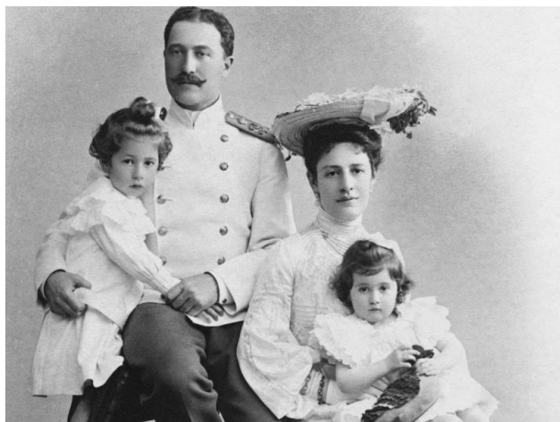
Рис. 8. Дворянская чета с детьми. Конец XIX в.

ния суда в законную силу, при этом заинтересованные лица имели право оспаривать решение в двухгодичный срок 1 .