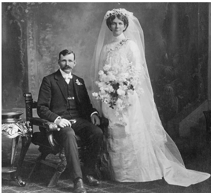
Рис. 1. Жених и невеста. Конец XIX в.

В допетровскую эпоху минимальный брачный возраст определялся церковным каноническим правом, но нормы эти постоянно колебались. С XVIII в. в регулирование этого вопроса уже вмешивается государство. Однако установленный законом брачный возраст в XVIII и даже начале XIX в. колебался. Так, по указу Петра I о единомословию, брачный возраст определен для мужчин в 20 лет, а для женщин – в 17. С отменой указа эта норма утратила силу. В 1774 г. Синод предписывал духовенству разведывать, «чтобы они возраст имели, юноши не менее 15 лет, а девицы в 13 лет» 1 . Возраст, назначенный этим указом, в XIX в. был признан чрезмерно низким, и в 1830 г.