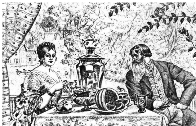
Рис. 3. Б.М. Кустодиев. Купец и его жена.

родительское хозяйство. Однако, несмотря на такую нечеткость, основная посылка закона ясна: в семье, как и в государстве и обществе в целом, индивиды определяются с точки зрения их положения. При этом, как отмечал В. Вагнер, – «в иногда перекрывающихся структурах подчинения приоритет устанавливался на основе старшинства и пола» 1 .