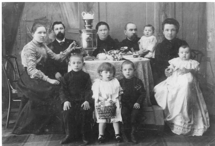
Рис. 5. Мещанская семья. 1900-е гг.

«...брак есть полное единение, начало имущественной разделенности вводит в него обособление» 1 .