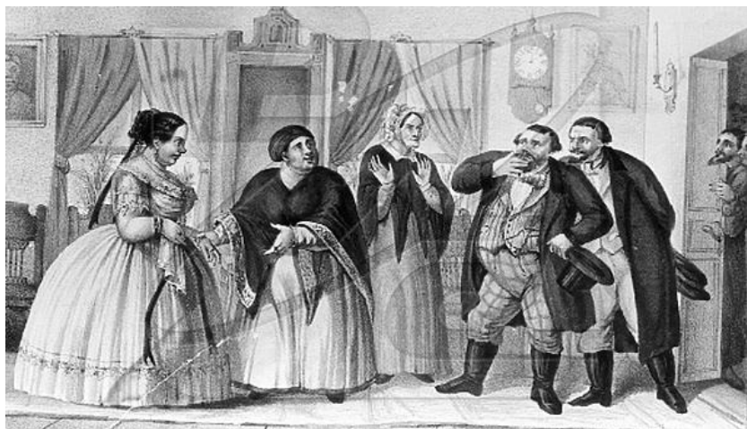
Рис. 2. Купеческое сватовство. Картина середины XIX в.

Для вступления в брак было необходимо заручиться согласием родителей. В Своде присутствовало безусловное требование согласия на брак со стороны родителей, опекунов или попечителей (статья 6). При этом законодательство стремилось примирить две противоположных традиции: сохранить свободное волеизъявление брачующихся и дать в то же время место для участия в заключении брака воле родителей. В силу этого в статье 12 Свода было зафиксировано: «Брак не может быть законно совершен без взаимного и непринужденного согласия сочетающихся лиц; посему запрещается родителям своих детей и опекунам лиц, вверенных их опеке, принуждать к вступлению в брак против их желания» 1 .