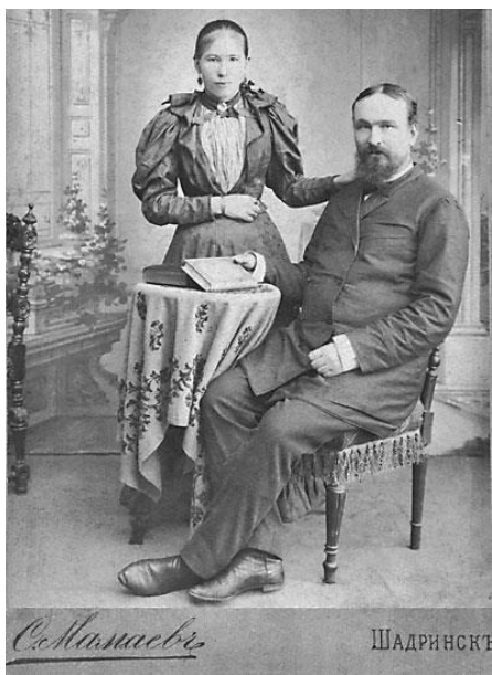
Рис. 6. Супружеская чета из духовного сословия. Начало XX в.

Таким образом, основой личных взаимоотношений супругов в браке являлся институт власти мужа, который выражался в обязанности жены проживать совместно с мужем, следовать за ним при перемене места жительства, повиноваться ему, а также пребывать к нему в любви и неограниченном послушании. Без согласия мужа жена не могла заключать сделки, а также принимать участие в гражданском процессе, защищая свои права. Мужу принадлежала также отеческая власть, т.к., он являлся преимущественным опекуном своих детей. Для поступления замужних женщин на государственную и общественную службу, или в некоторые учебные заведения также требовалось согласие мужа.