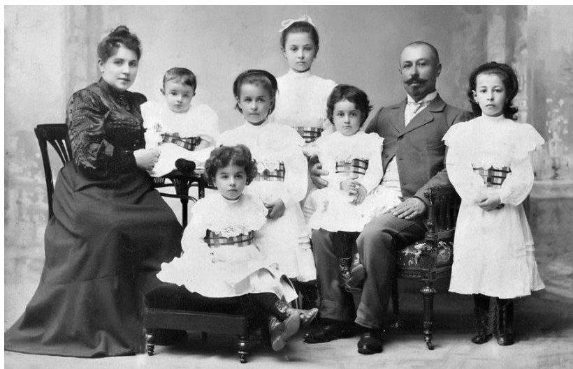
Рис. 4. Купеческая семья. Конец XIX в.

оно не пользуется, благодаря этому, большим авторитетом» 1 .