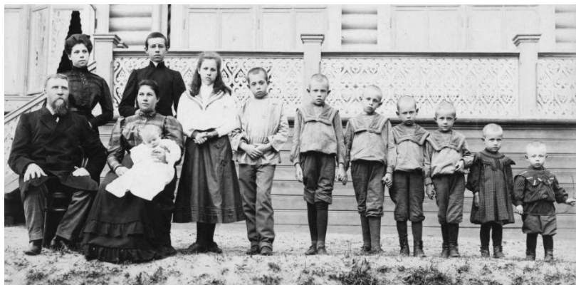
Рис. 7. Купеческое семейство с детьми. Начало XX в.

данским, ни уголовным порядком. Но правило сие не распространяется на те случаи, когда родители, в отношении к лицу детей своих, покушаются на такие деяния, которые по общим законам подлежат наказанию уголовному» 1 .